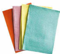
Pacientní roušky 500 ks Cena základní 562 Kč s DPH Cena snížená 518 Kč s DPH