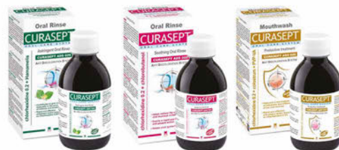
Curasept Ústní voda Adstringent, Soothing, Protective Cena základní 171 Kč s DPH