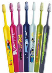
TePe Zoo Compact x-soft, soft Cena základní 47 Kč s DPH