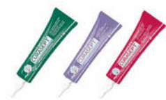
Curasept Gel Regenerating, Adstringent, Soothing Cena základní 167 Kč s DPH