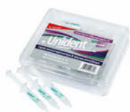
Unident Bělící gel 16% Cena základní 579 Kč s DPH