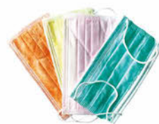
Ústenky (vínová, zlená, fialová, limetková, oranžová, žlutá a růžová) Cena základní 163 Kč s DPH Cena snížená 129 Kč s DPH