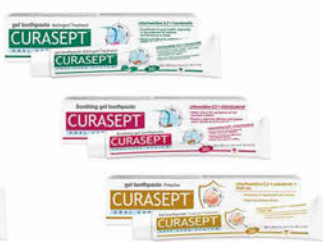
Curasept Pasta Soothing, Adstringent, Protective Cena základní 132 Kč s DPH