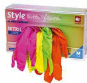
Rukavice XS, S, M, L (zelené, žluté, tmavě růžové, tutti frutti) Cena základní 365 Kč s DPH Cena snížená 302 Kč s DPH