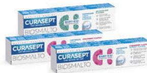
BIOSMALTO Baby Kid 6 měsíců - 6 let Mint, Jahoda Cena základní 119 Kč s DPH

Při koupi 2 ks zubní pasty Biosmalto KID ZDARMA Biosmalto Jahoda bez fluoridů