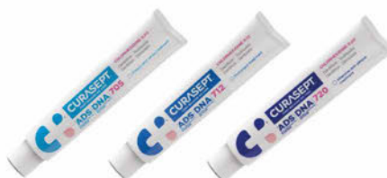
Curasept ADS DNA 705, 712, 720 zubní pasta Cena základní 135 Kč s DPH