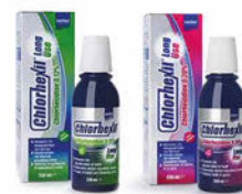
CHLORHEXIL ústní voda Long use 0,12%, 0,20% Cena základní 135 Kč s DPH