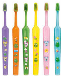
TePe GOOD mini x-soft Cena základní 52 Kč s DPH