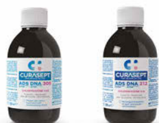
Curasept ADS DNA 205, 212, 220 ústní voda Cena základní 172 Kč s DPH