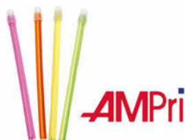
Savky 100 ks Cena základní 85 Kč s DPH Cena snížená 76 Kč s DPH