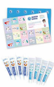
Curasept Kid, Baby Cena základní 66 Kč s DPH