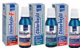
CHLORHEXIL ústní voda F, 0,12%, 0,20 % 250 ml Cena základní 125 Kč s DPH