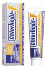
Chlorhexil zubní pasta F 100 ml Cena základní 149 Kč s DPH