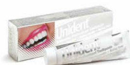
Unident White 100 ml Cena základní 219 Kč s DPH